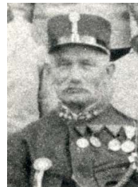
Andreas Kraus 1890 – 1919