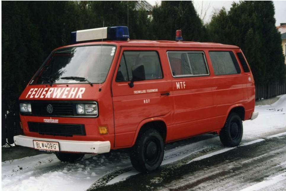
Mannschaftstransportfahrzeug VW Kombi CL

Durch den hohen Mannschaftsstand, sowie aufgrund des Alters des vorhandenen Mannschaftstransportfahrzeuges, musste im Frühjahr 1991 ein weiteres Fahrzeug angekauft werden.