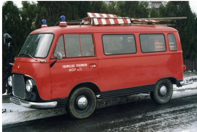
Das erste Hofer Feuerwehrauto Ford Transit

1966 wurde von der Fa. Breitfeld das erste Hofer Feuerwehrauto angekauft. Dieses Auto, ein Ford Transit mit 55 PS, entsprach zu dieser Zeit dem modernsten Stand der Technik. Neben der vorhandenen Tragkraftspritze sowie allem erforderlichen Schlauchmaterial und diversen Kleinlöschgeräten konnten in diesem Fahrzeug auch bis zu neun Mann transportiert werden.