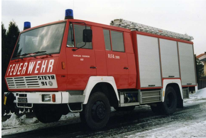
Rüstlöschfahrzeug RLFA 2000

Noch im selben Jahr wurde von der Feuerwehr ein weiteres Fahrzeug, ein Kleinlöschfahrzeug, angekauft.