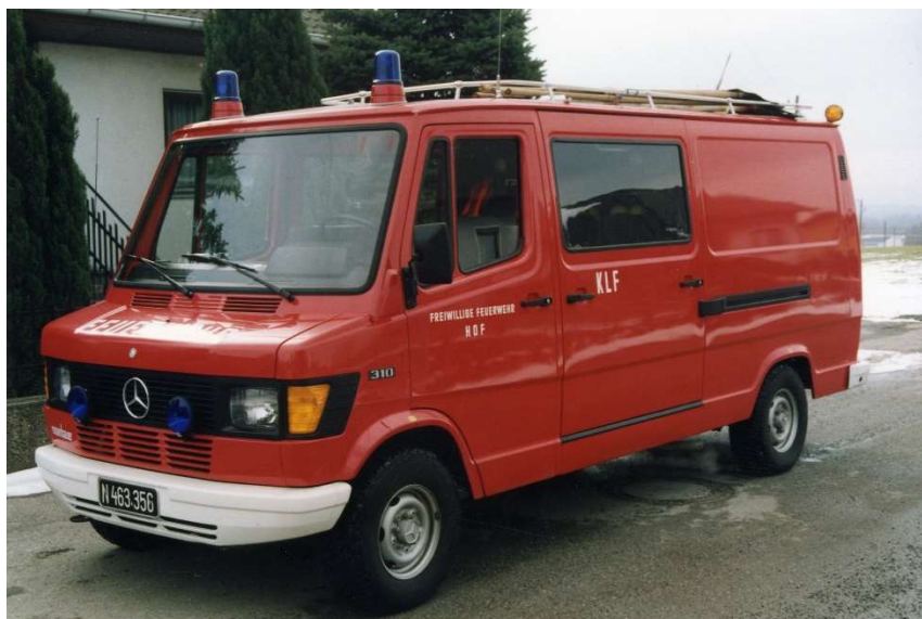
Kleinlöschfahrzeug Mercedes 310

Noch im selben Jahr wurde von der Feuerwehr ein weiteres Fahrzeug, ein Kleinlöschfahrzeug, angekauft.