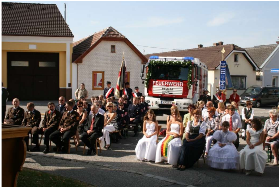
Segnung vor dem Feuerwehrhaus

Mit einer sicherlich einmaligen und spektakulären Licht- und Tonpräsentation wurden die vielen Ehren- und Festgäste am 06. September 2008 bei der Vorstellung des neuen Rüstlöschfahrzeuges 2000 und dem 125-jährigen Bestandsjubiläum der Freiwilligen Feuerwehr Hof unterhalten. Prominentester Gast war neben der Partnerfeuerwehr aus Traunwalchen (Bayern) natürlich der Kommandant des Niederösterreichischen Landesfeuerwehrverbandes LBD KR Josef Buchta und Bezirksfeuerwehrkommandant OBR Franz Pinter.